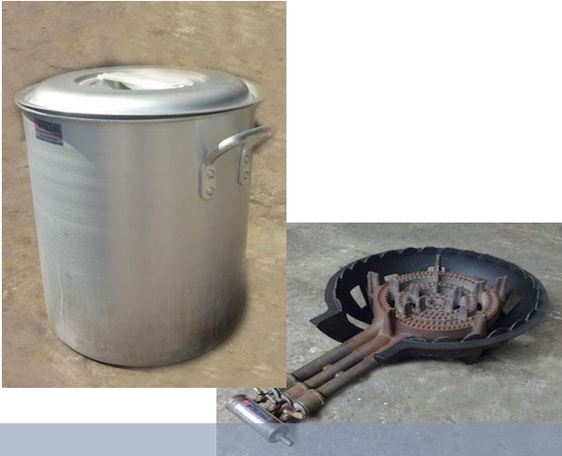
⑰寸胴鍋 & 鋳物コンロ(特大)