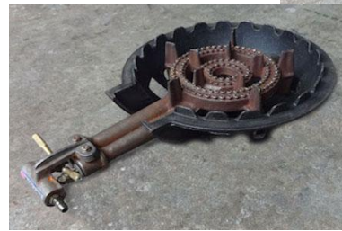
⑭ワッフル機 & 鋳物コンロ (大)