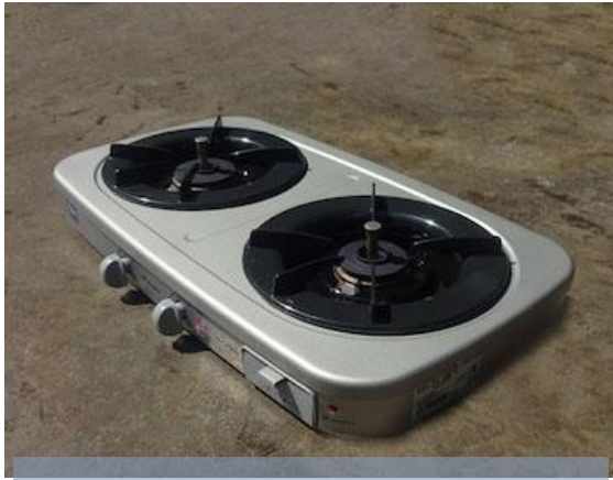
⑬二口ガステーブル