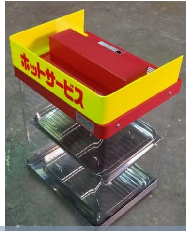
⑱ホットショーケース