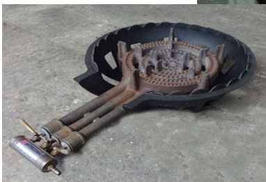
⑮角蒸し器 & 鋳物コンロ (特大)